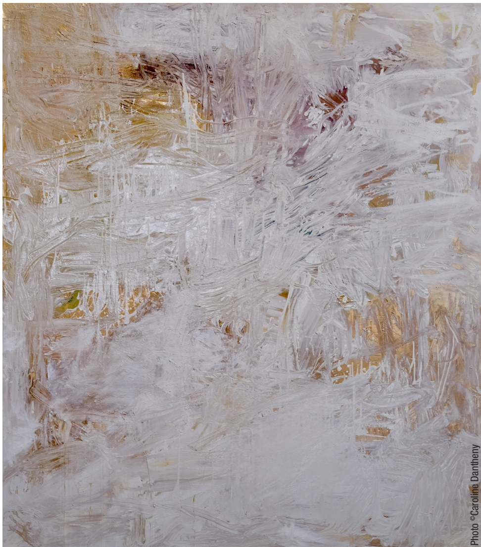
«Sans Titre A», 2022, 215 x 190 cm, olio su tela.