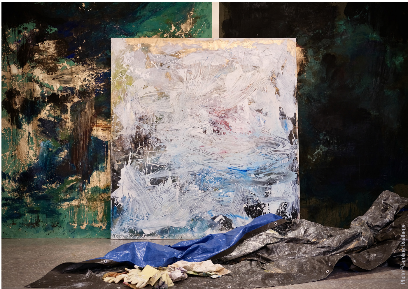
Nel studio del artista a Palazzo Morosini, «Le Grand Bain» e «Nella notte buia I & II».