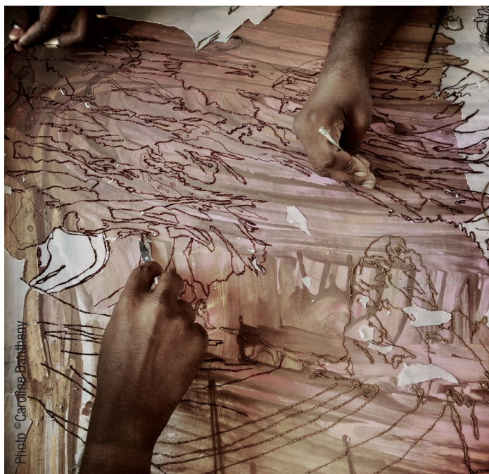
Mani al lavoro su «Le Dernier Royaume».